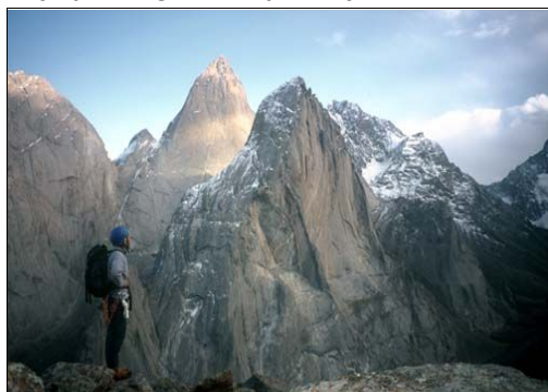
Wrota doliny Ak-Su.