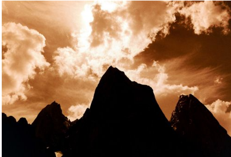
Wyprawa Akademickiego Klubu Górskiego z Łodzi w rejon Karavshin w Kirgizji