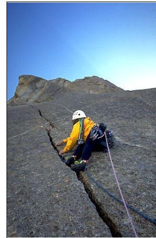
Lynn Hill na „Perestroika Crack”, fot. Geg Child.